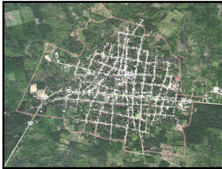
Mapa 2. Plano geográfico de Tihosuco.

Tihosuco es una comunidad perteneciente a la cultura maya y actualmente cuenta con una población de 4,992 1 habitantes, distribuyéndose los géneros de la siguiente manera: mujeres 2552 y 2442 hombres.