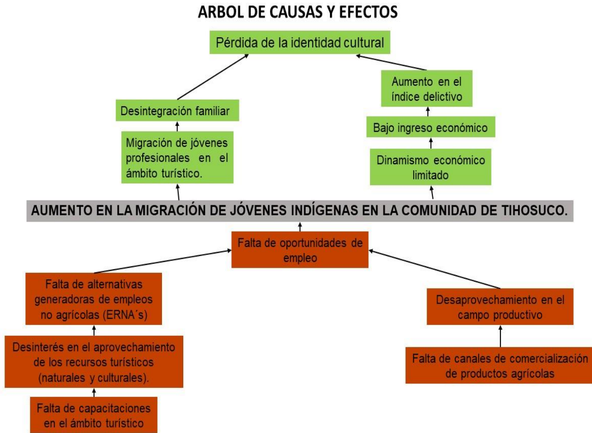
Diagrama 1. Causas y efectos del aumento en la migración de jóvenes indígenas en la comunidad de Tihosuco.

El siguiente esquema muestra las causas y efectos del fenómeno migratorio en la comunidad de Tihosuco, observando de manera clara que el aspecto económico es que resulta determinante para la migración de los jóvenes.